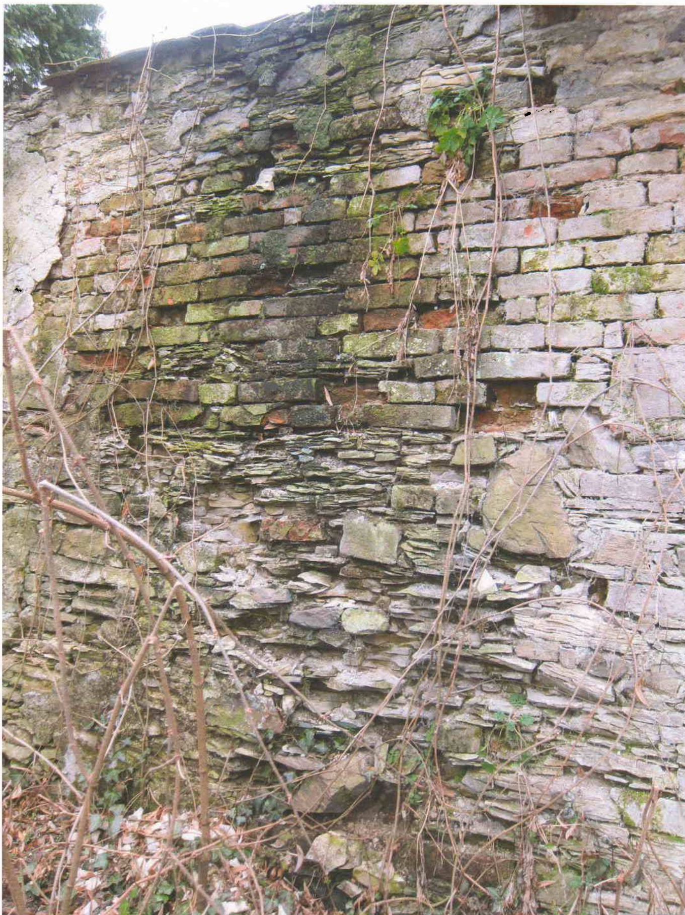
11) Gloriet – detailní pohled na opěrnou zeď na jihozápadní straně stavby, totálně narušenou zatékáním srážkových vod