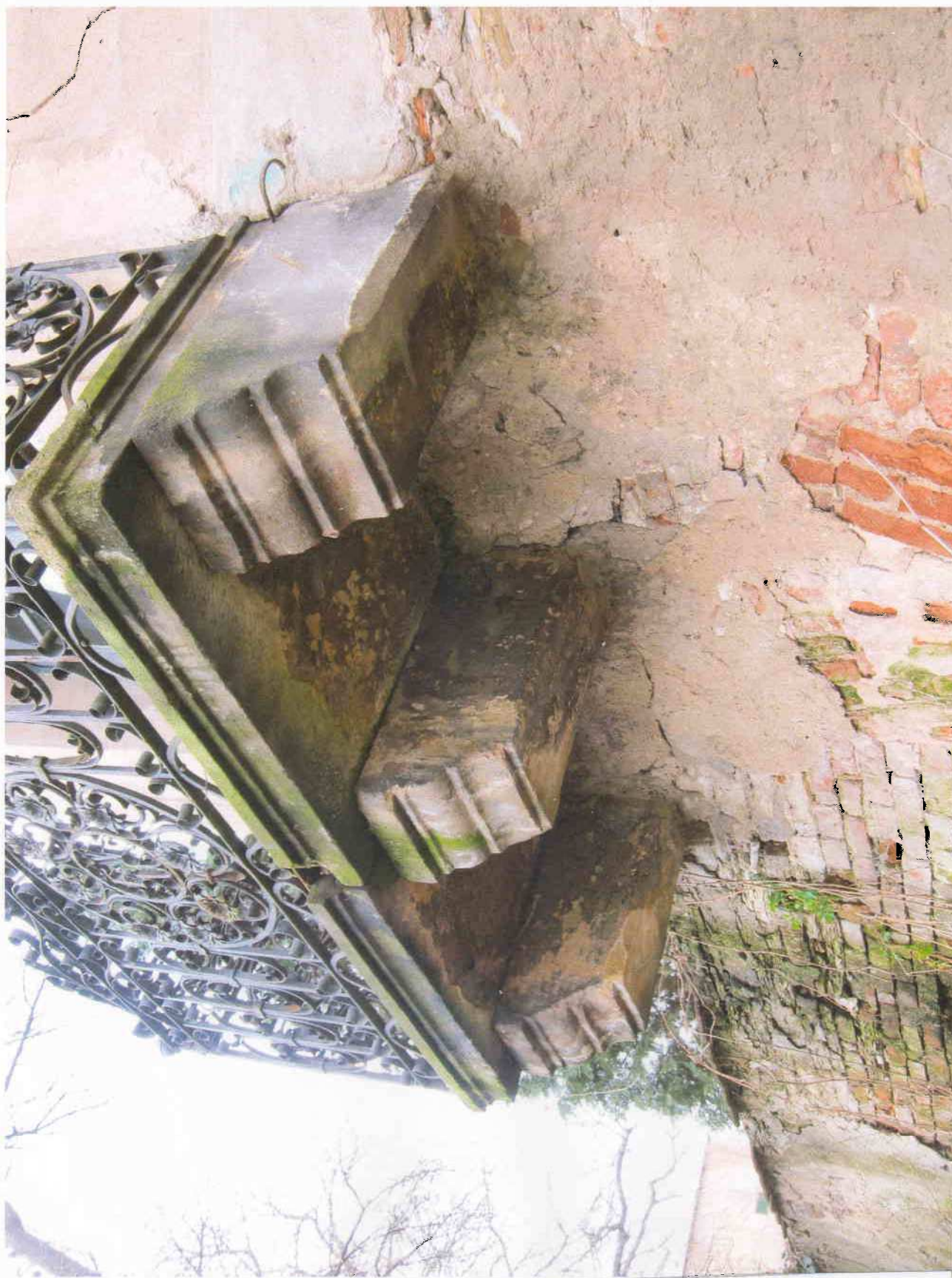
4) Gloriet – pohled ze spodní terasy na nosnou konstrukci balkonu; vlevo patrné narušení opěrné zdi