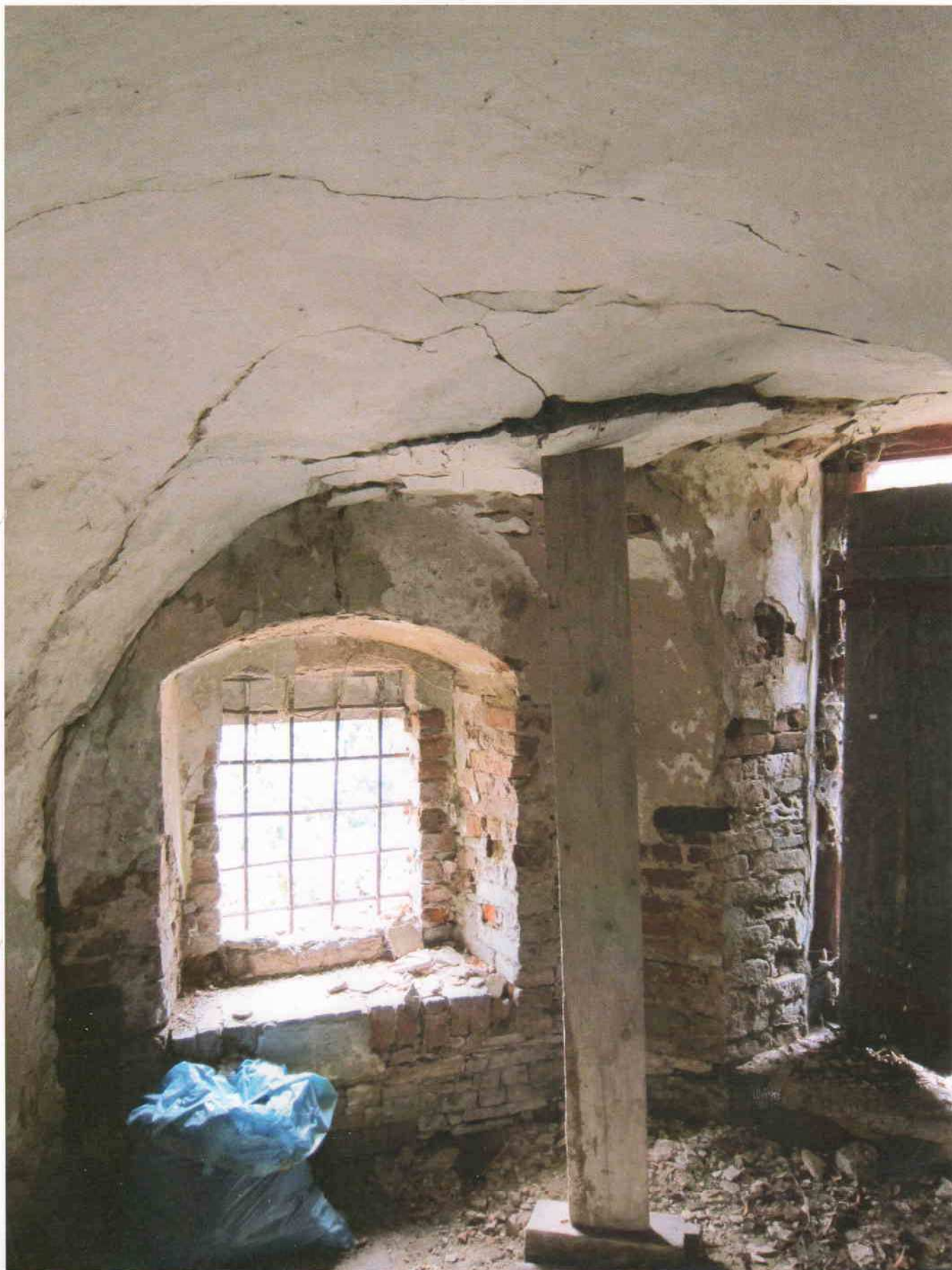
6) Gloriet – suterénní místnost – patrně vysunutí zdiva klenby v jihozápadní části z obrysu a její laické podepření; další trhliny v klenbě signalizují její narušení na jižní straně