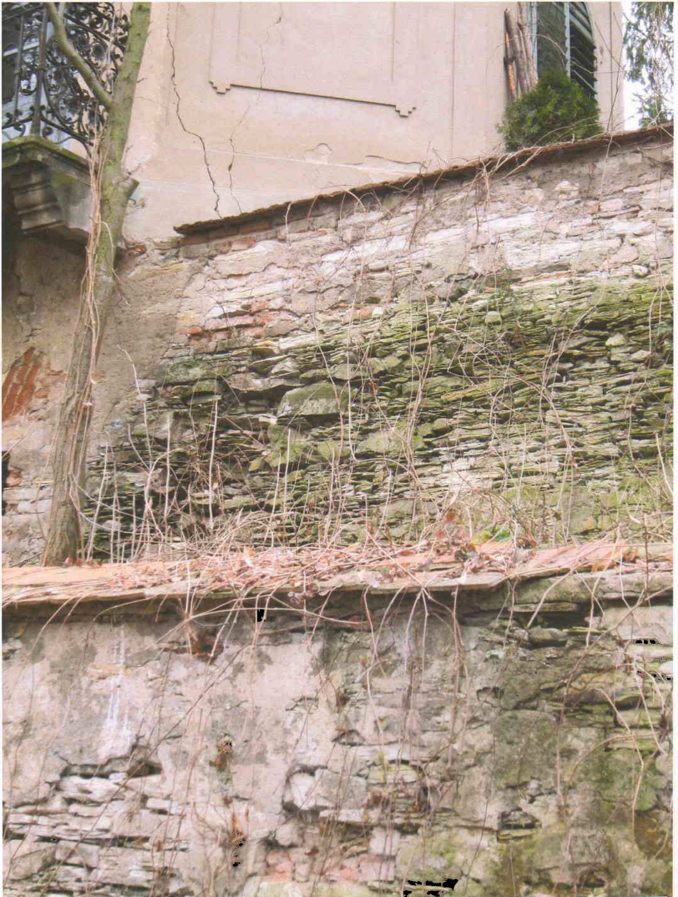
10) Gloriet – bližší pohled na opěrnou zeď na jihovýchodní straně glorietu; v horní části patrný trhliny obvodového zdiva a totální narušení zdiva opěrné zdi