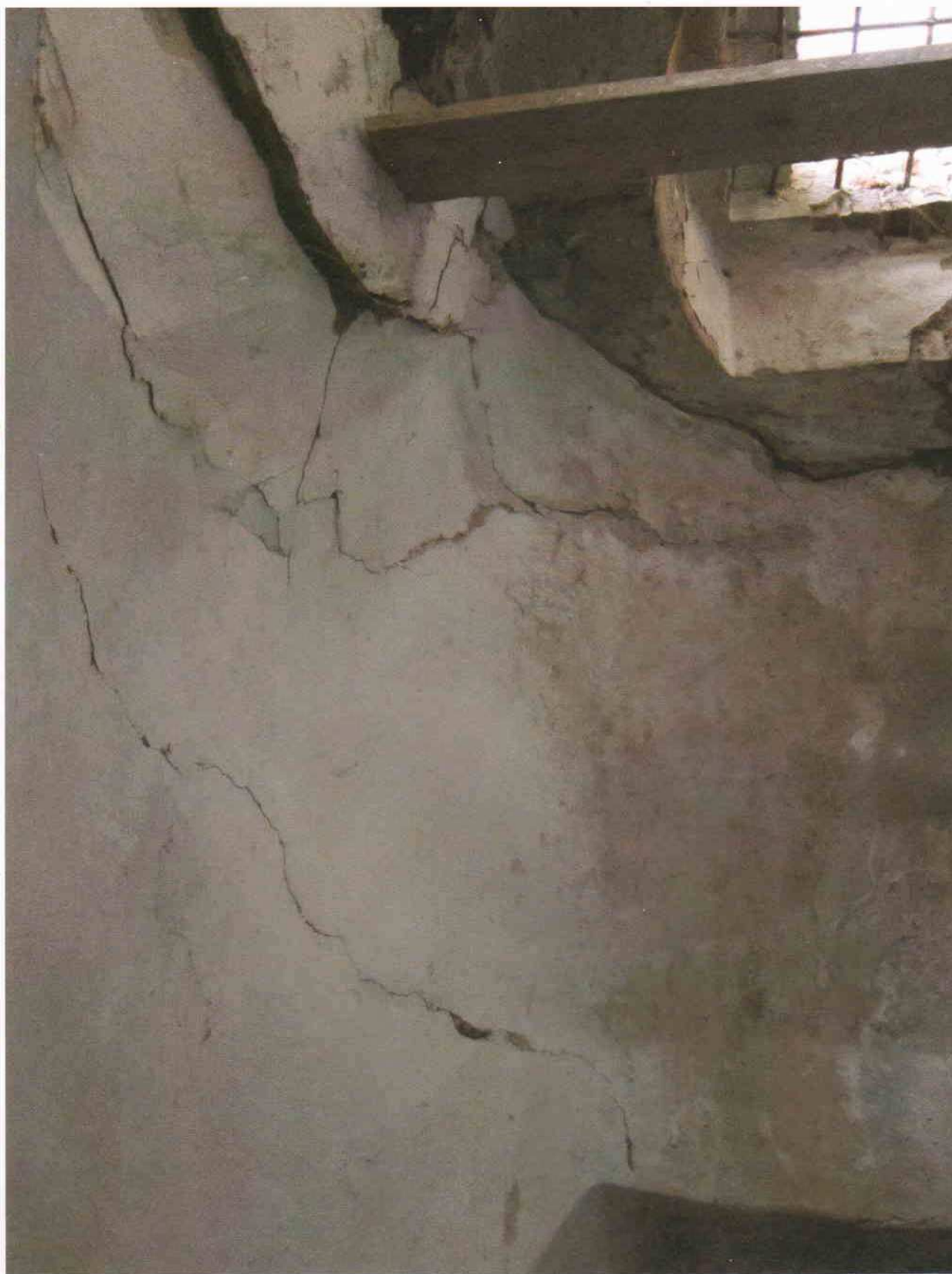
7) Gloriet – bližší pohled na trhliny klenby na jihovýchodní straně suterénní místnosti