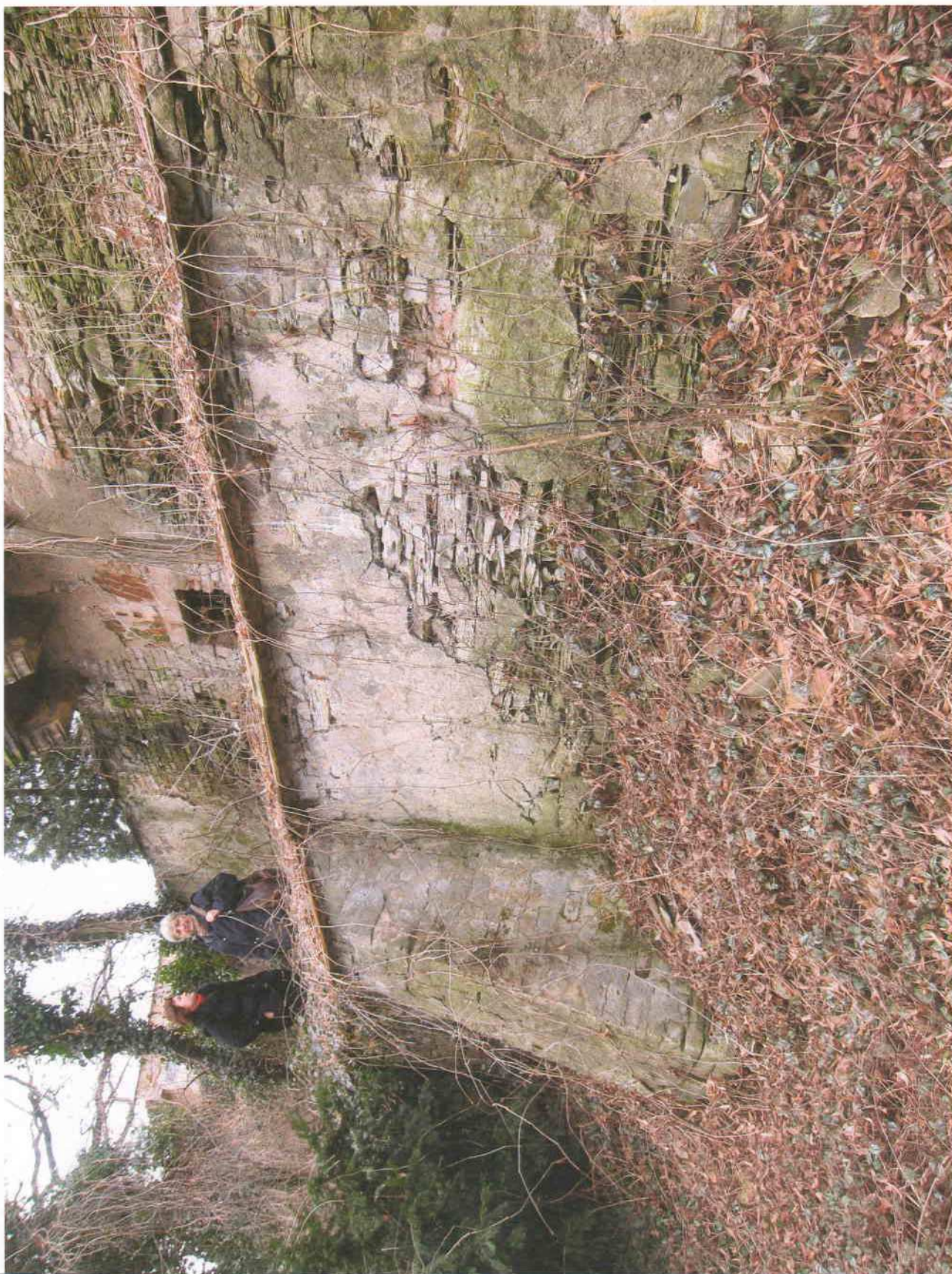
9) Gloriet – pohled z úrovně labské promenády; uprostřed patrně okno suterénní místnosti a nad ním konstrukce balkonu; patrný stav opěrných zdí z opukového zdiva narušeného zatékáním srážkových vod