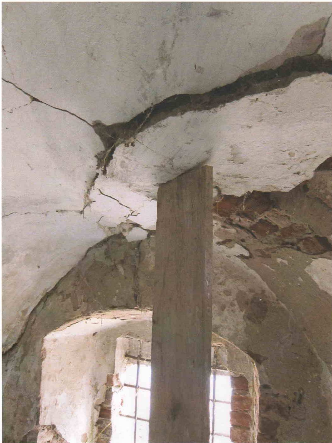
8) Gloriet – detailní pohled na vysunuté zdivo z obrysu klenby; v pozadí patrně cihelné zdivo klenby; předpokládaná tloušťka 150 mm