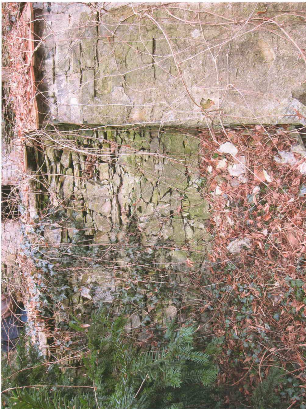
12) Gloriet – detailní pohled na stav dolní opěrné zdi vedle původního podpůrného pilíře