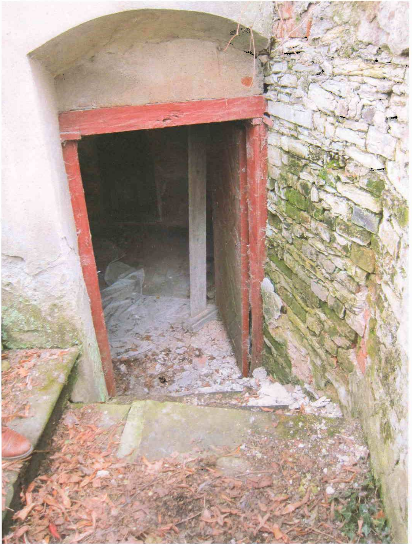
5) Gloriet – pohled na vstup do suterénní místnosti na jihozápadní straně